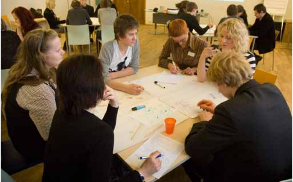
11. märtsil toimunud arutlusringis esitasid noored oma mõtteid ja ettepanekuid.

tut ka kriitiliselt, sest kindlasti ei õnnestunud kõik sajaprotsendiliselt. Ühe vajakajäämisena tuleks nimetada vähest jõudlust, et pidada tihedat infovahetust kaasatavatega ja anda neile pidevat teavet arengukava koostamise käigust, edusammudest ja tagasilöökidest. Suhtlust kaasatavatega tuleb järgmistel korradel kindlasti parandada.