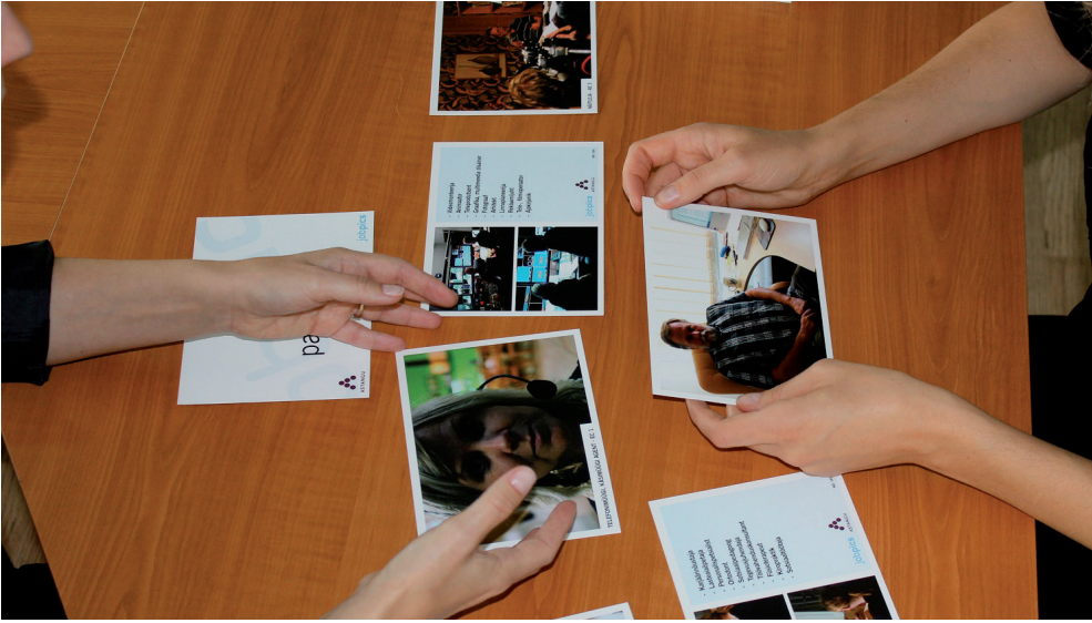
Jobpicsi nõustamisprotsess.

valida, mida ma oma elus teen?». Juba esimene tunne seda suurt pildipakki vaadates on rõõmustav – nii palju valikuid! Samas on kutsevalik pikaajaline protsess. See on üks maamärgi paneku koht tuleviku kaardistamisel.