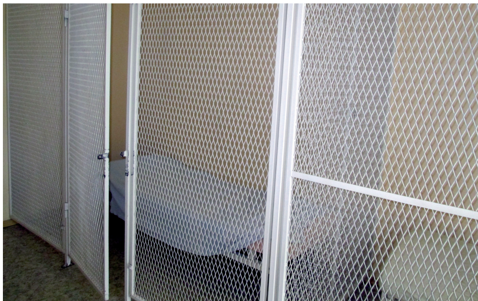
„Puurid” erihooldekodus.

dusõiguse piiramine, tuleks sellele olukorrale pöörata viivitamatult kõrgendatud tähelepanu ja leida asjakohased lahendused. Esmalt on vaja välja selgitada, mis on kliendi (agressiivse) käitumise põhjustaja (nt kliendil on lahendamist vajav füüsilise tervise häda, ta ei sobi mõne teise kliendiga kokku, tagatud pole piisavalt privaatsust). Seejärel saab töötajatega koos analüüsida, milline on tema suhtes sobivaim õiguspärane lahendus. Teisisõnu peaks klientide vabaduspõhiõiguse kaitse algama ennetustööst.