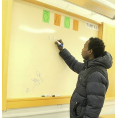
Eesti keele tund Vao keskuses.

Nende positiivsete aspektide kõrvale tooksin välja ka paar ala, kus minu arvates on veel arenguruumi. Eesti keele kursust tuleks pakkuda erinevatel keeletasemetel (kaasa arvatud